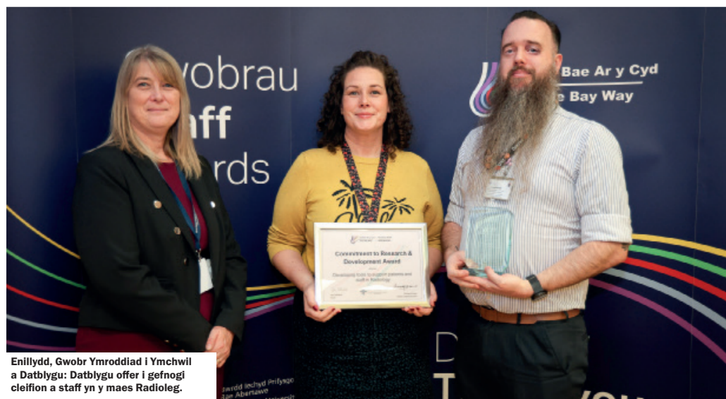
Enillydd, Gwobr Ymroddiad i Ymchwil a Datblygu: Datblygu offer i gefnogi cleifion a staff yn y maes Radioleg.