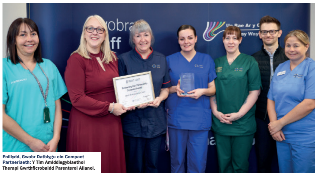
Enillydd, Gwobr Datblygu ein Compact Partnership: Y Tim Amlddysgyblaethol Therapi Gwrthficrobaidd Parentrol Allanol.

Cafodd gwobrau staff Bae Abertawe eu hailwampio eleni – brand newydd ar gyfer 2024 a fformat gwahanol i ddisodli ein noson draddodiadol o ddathlu.