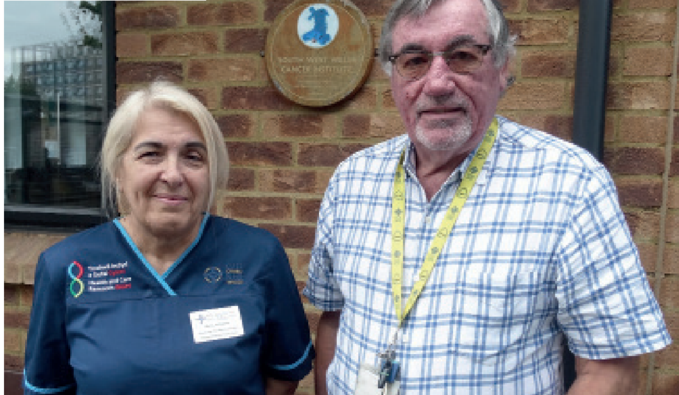
"Roedd ychydig llai na 1,000 o gleifion yn y treial hwnnw, yn fyd-eang," meddai'r Athro Wagstaff.

"Roedd pum canolfan yn y Deyrnas Unedig yn cymryd rhan. Gwnaethon ni recriwtio 17 o gleifion o bob rhan o Gymru, ac un o Loegr. Ni oedd y pumed neu'r chweched ganolfan o ran niferoedd a gafodd yr recriwtio yn y byd ac rydw i'n gydaudur ar yr holl gyhoeddiadau sydd wedi'u cyhoeddi am y treial.