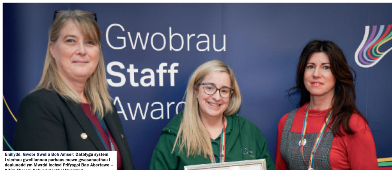
Enillydd, Gwobr Gwella Bob Amser: Datblygu system i sicrhau gwelliannau parhaus mewn gwasanaethau i deutoedd ym Mwrdd Iechyd Prifysgol Bae Abertawe - Y Tim Therapi Galwedigaethol Pediatrig.