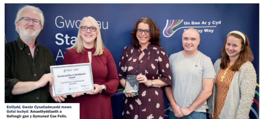
Enillydd, Gwobr Cynaliadwyedd mewn Gofal Iechyd: Amaethyddiaeth a Gefnogr gan y Gmuned Cae Felin.