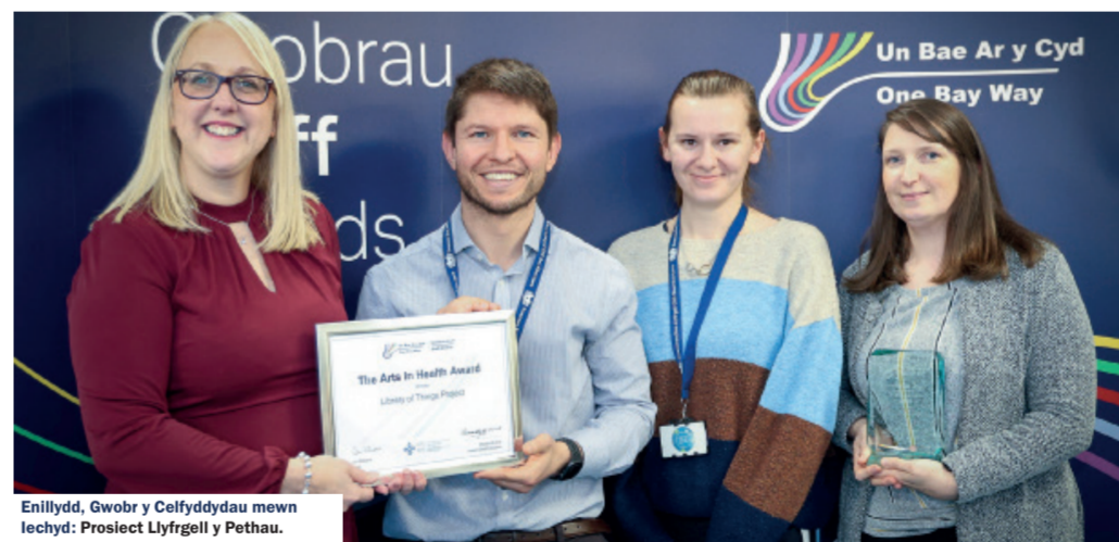
Enillydd, Gwobr y Celfyddydau mewn Iechyd: Prosiect Llŷfregi y Pethau.