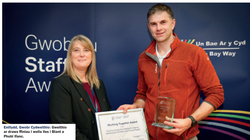
Enillydd, Gwobr Cyweithio: Gweithio ar draws ffiniau i wella lles i blant a Phobl Ifanc.