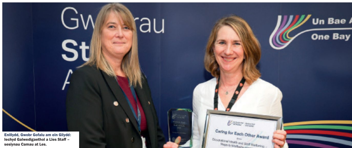
Enillydd, Gwobr Gofalu am ein Gilydd: Iechyd Galwedigaethol a Lles Staff - sesynau Camau at Les.